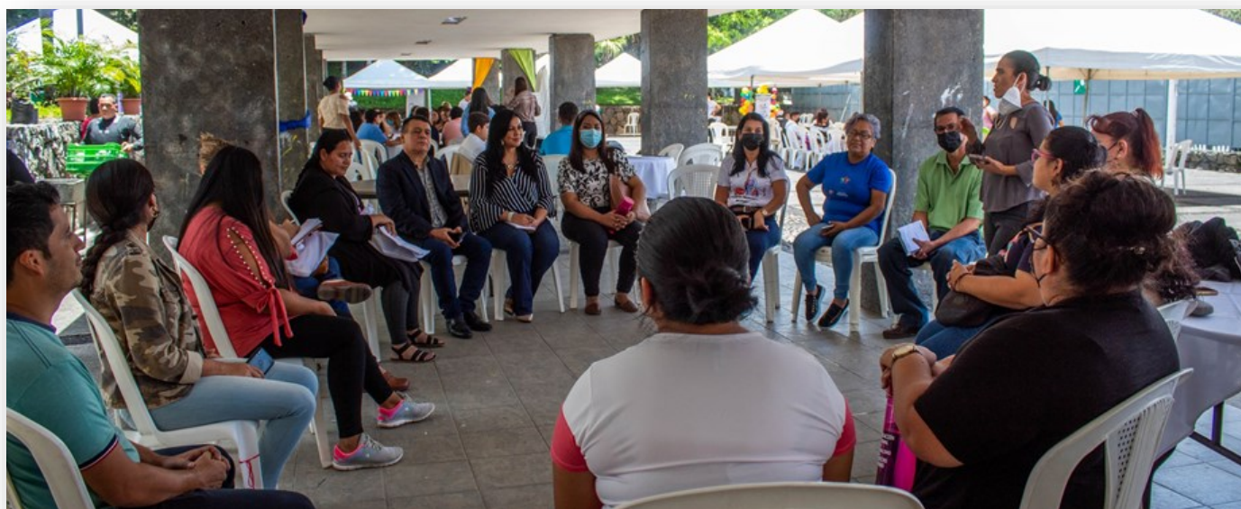
Participantes en el congreso en grupos de trabajo

“Había alumnas que ya tenían hasta dos hijos y siguieron estudiando hasta terminar su noveno grado, sin embargo, sabemos que no todas llegan a esa etapa, son pocas las que continúan el bachillerato”, afirmó la docente.