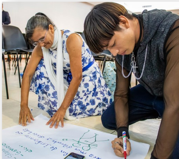
Grupo de trabajo de diferentes edades. Jóvenes y líderes de comunidades participaron en el congreso.

“Por supuesto que sí, por ejemplo, el respeto a los derechos de la población LGBTI, tiene que ver con sus derechos sexuales y el derecho a escoger su opción. Sin embargo, vamos cuesta arriba porque tenemos muchos años luchando por el respeto a los derechos y todavía hay mucha discriminación y violencia para este sector, y nadie debería ser agredido ni por su forma de ser ni por su forma de pensar”, afirma.