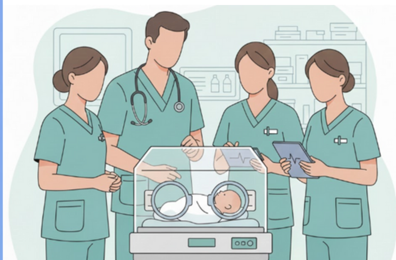
Ilustración generada con IA-Google Gemini

A nivel mundial, en 2022 murieron 2,3 millones de recién nacidos en los primeros 28 días de vida, es decir, durante la etapa neonatal, lo que representa el 47% de las muertes de niñas y niños menores de cinco años, de acuerdo con la Organización Mundial de la Salud (2024). (1)